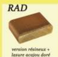
version résineux + lasure acajou doré