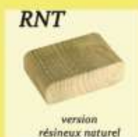
version résineux naturel