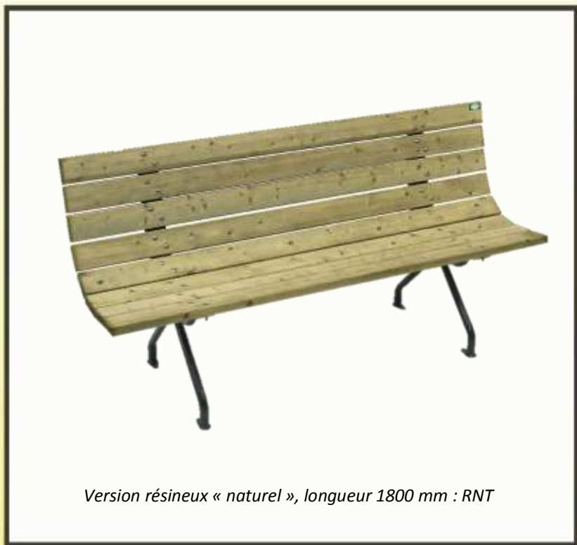
Version résineux « naturel », longueur 1800 mm : RNT